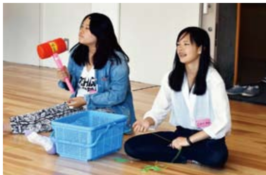
「中京高校生ボランティア」