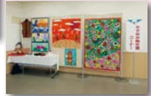
福祉施設作品展示