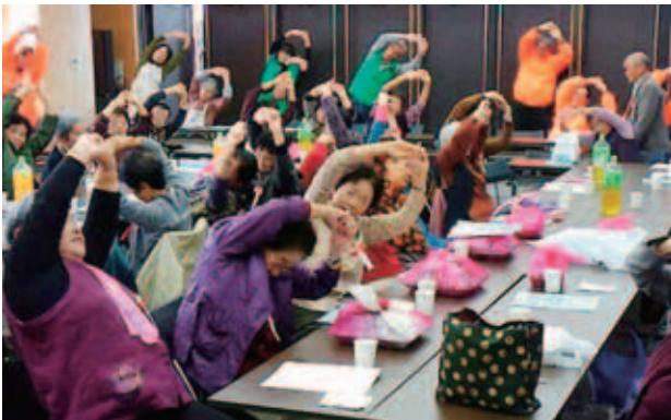
健康体操しましょう