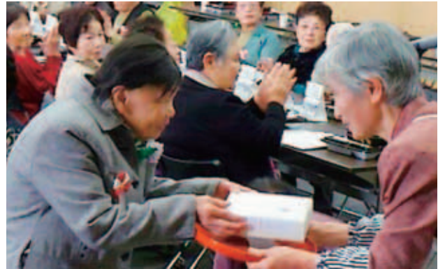
赤十字奉仕団より記念品贈呈