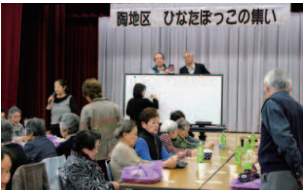
なかなかそろわないビンゴ