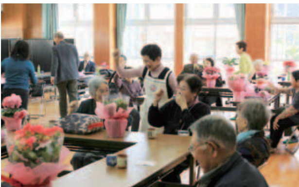
勝ったら肩をもんでもらえるじゃんけんゲーム

歳末たすけあい募金の配分事業として、「ひなたぼっこのつどい」が今年も各地で開催されました。