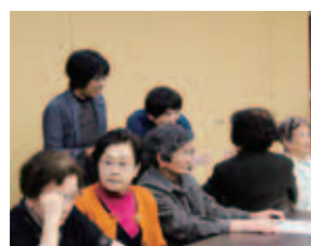
ボランティアさんの取材を受けています

赤十字奉仕団や民生児童委員協議会、社協支部からもお土産をいただき、帰りには両手いっぱいになってしまいました。