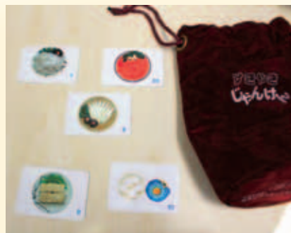
すきやきジャンケン