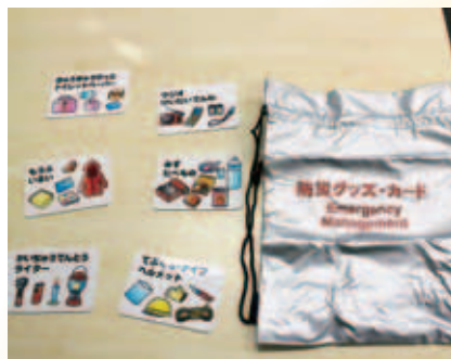
防災グッズカード