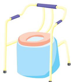
ポータブルトイレ