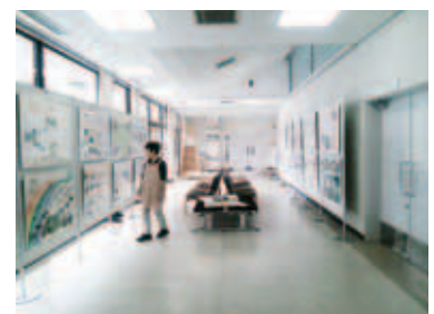
6月1日～6月11日まで稲津コミュニティーでも展示しました