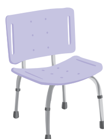
シャワーチェアー